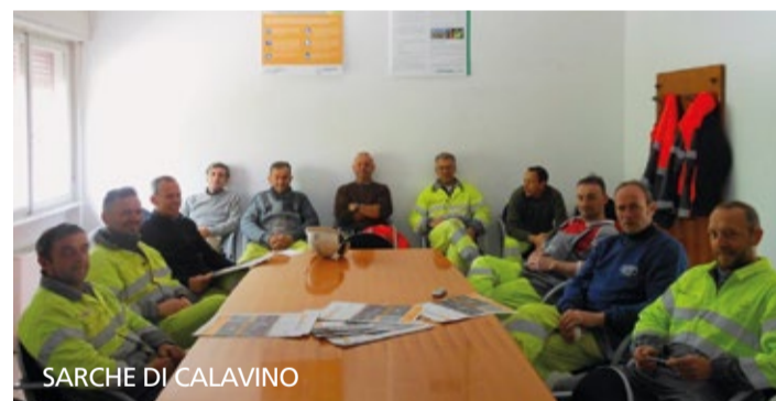
SARCHE DI CALAVINO