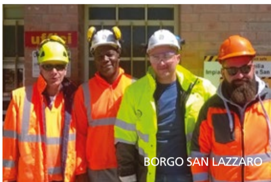
BORGO SAN LAZZARO