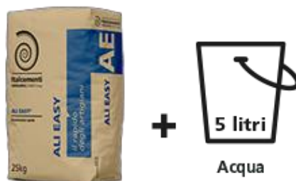
1 sacco da 25kg